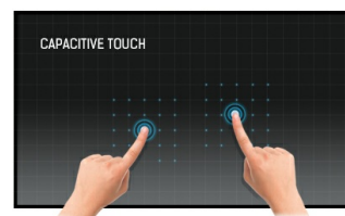
Touch Technologie - Kapazitiv

Dank des Android-Betriebssystems können Applikationen einfach installiert werden und der Bildschirm ganz flexibel Ihren Bedürfnissen angepasst werden.